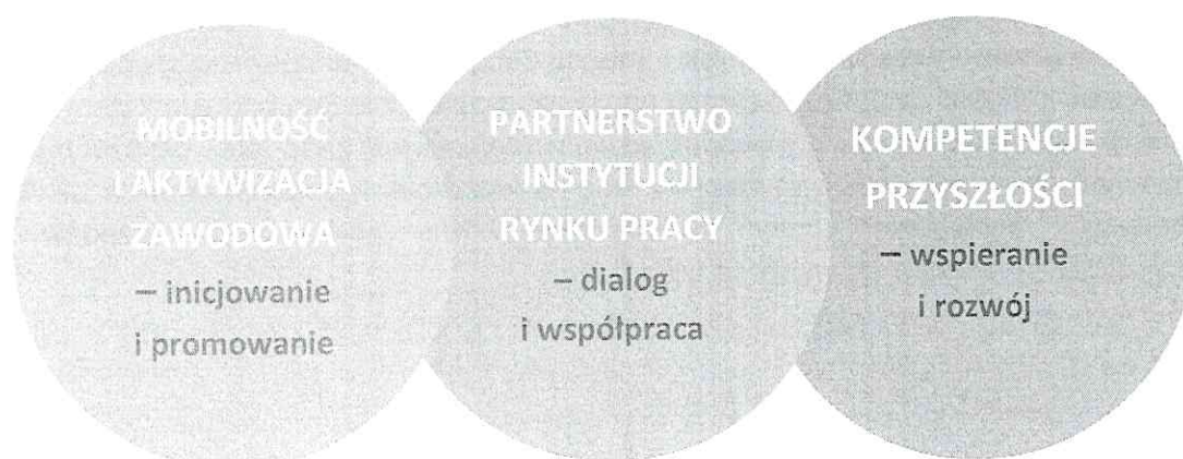
Schemat 1. Wyzwania polityki rynku pracy dla województwa pomorskiego na 2020 rok

Mając powyższe na uwadze, sformułowano trzy wyzwania regionalnej polityki rynku pracy na rok 2020. Określenie wyzwań oraz zaplanowanie i realizacja działań spójnych z tymi wyzwaniami, niewątpliwie przyczyni się do rozwoju pomorskiego rynku pracy.